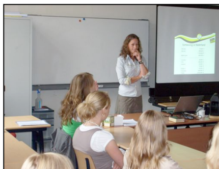
Aan aandacht geen gebrek...