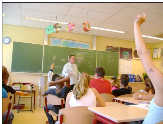
Het levens verhaal dat de ervaringsdeskundige 'deelt' met de leerlingen heeft doorgaans veel impact